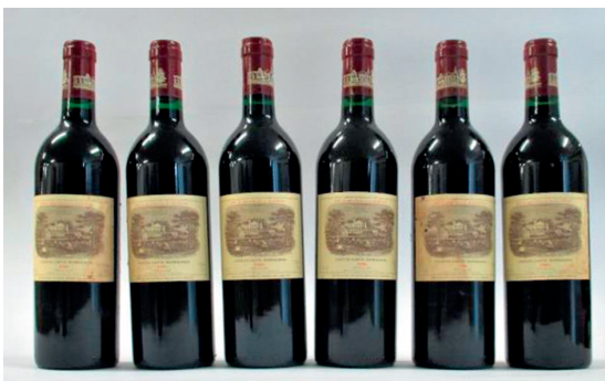
Lot 482, 6 Flaschen Ch. Lafite Rothschild 1886