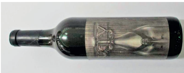
Lot 558 das Weinle vom Steinle mit H.R. Giger-Etikett (wird am Auktionstag gezeigt)