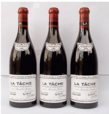
Lot 399, 400 und 401