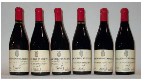
Lot 469 und 470, Chambolle Musigny Les Amoureux 1988