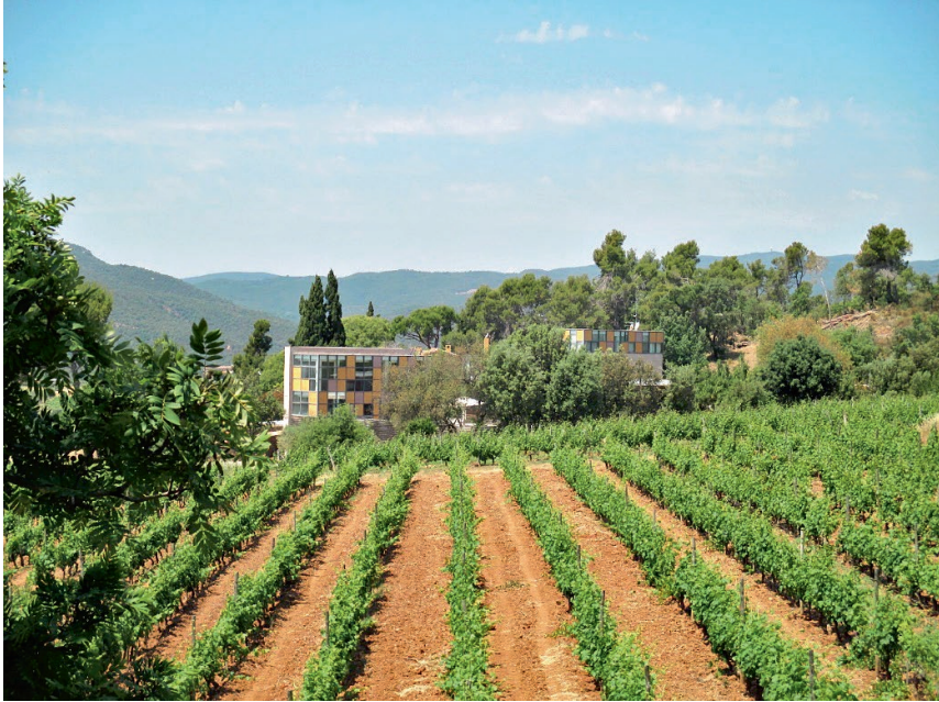
Bodega Clos d'Agon, Calonge, Costa Brava/Spanien (DO Catalunya)