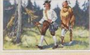
Die Arbeit der Indianer: Die Indianer sind hier zu sehen, die sie mit ihren Waffen und ihren Tieren durch das Land ziehen. Die Eroberer sind ihnen gegenüber zu sehen, die sie mit ihren Pfeilen und ihren Speeren bekämpfen.