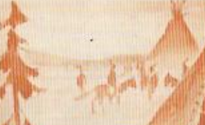
Die Arbeit der Indianer: Die Indianer sind hier zu sehen, die sie mit ihren Waffen und ihren Tieren durch das Land ziehen. Die Eroberer sind ihnen gegenüber zu sehen, die sie mit ihren Pfeilen und ihren Speeren bekämpfen.