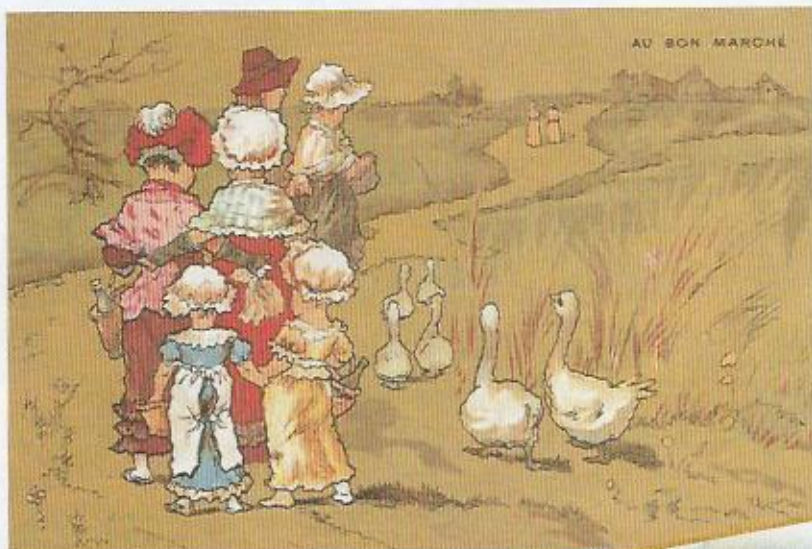
Auf Wiedersehen: Das Pariser Kaufhaus Au Bon Marché verführte 1870 die Kundschaft mit Sammelbildern zu weiteren Einkäufen.