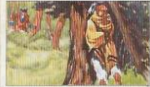
Die Arbeit der Indianer: Die Indianer sind hier zu sehen, die sie mit ihren Waffen und ihren Tieren durch das Land ziehen. Die Eroberer sind ihnen gegenüber zu sehen, die sie mit ihren Pfeilen und ihren Speeren bekämpfen.