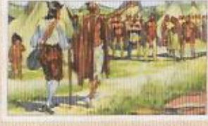
Die Arbeit der Indianer: Die Indianer sind hier zu sehen, die sie mit ihren Waffen und ihren Tieren durch das Land ziehen. Die Eroberer sind ihnen gegenüber zu sehen, die sie mit ihren Pfeilen und ihren Speeren bekämpfen.