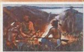
Die Arbeit der Indianer: Die Indianer sind hier zu sehen, die sie mit ihren Waffen und ihren Tieren durch das Land ziehen. Die Eroberer sind ihnen gegenüber zu sehen, die sie mit ihren Pfeilen und ihren Speeren bekämpfen.