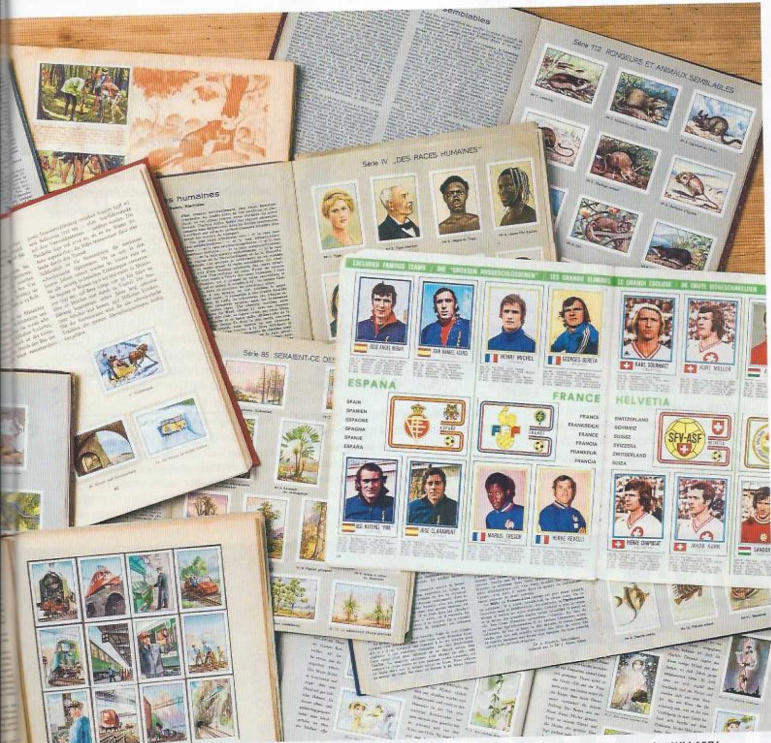
Die Vergangenheit aufgeblättert: Sammelalben aus dem vorherigen Jahrhundert. Dabei ein Panini-Heft von der WM 1974.

tüten» verpacken. Der erste Versuch, nur Sammelbilder mit Blumenmotiven zu verkaufen, wird ein Reinfall, während der zweite Anlauf, mit Bildern von Fussballspielern, gutes Geld einbringt. Das inspiriert Giuseppe, einen der vier Panini-Brüder, dazu, selber solche Sammelbilder herauszugeben. 1961 erscheint die erste Serie aus dem Hause Panini mit Fussballern aus der italienischen Meisterschaft. Das ist der Start zu einer Erfolgsgeschichte. Die Sammelbilder müssen vor dem Abpacken gemischt werden. Anfänglich ➔