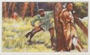
Die Arbeit der Indianer: Die Indianer sind hier zu sehen, die sie mit ihren Waffen und ihren Tieren durch das Land ziehen. Die Eroberer sind ihnen gegenüber zu sehen, die sie mit ihren Pfeilen und ihren Speeren bekämpfen.