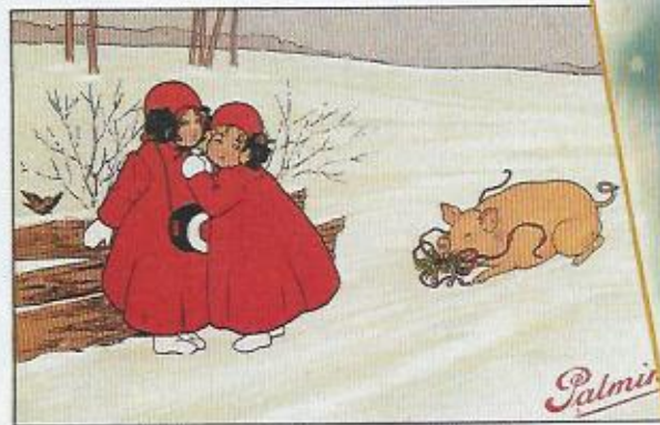
Glückwunsch zum Jahreswechsel: Eine Beigabe der Kokosfett-Firma Palmin.