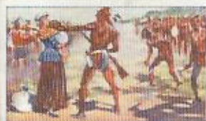
Die Arbeit der Indianer: Die Indianer sind hier zu sehen, die sie mit ihren Waffen und ihren Tieren durch das Land ziehen. Die Eroberer sind ihnen gegenüber zu sehen, die sie mit ihren Pfeilen und ihren Speeren bekämpfen.