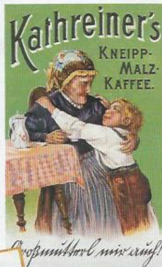
Mit bunter Werbung den Verkauf von Kaffee und Kakao ankurbeln: Zwischen 1880 und 1914 gab etwa die Firma Suchard 5000 Motive in 400 Serien heraus.

Die Schweizer sind ein Volk von Bildli-Sammlern. Das zeigt sich wieder in diesen Tagen vor der Fussball-Weltmeisterschaft in Brasilien. Die Vorfreude teilen Hunderttausende Kinder und Erwachsene, die die Bildli ihrer Stars sammeln und in ein Album kleben. Die Firma Panini aus dem italienischen Modena verdient sich damit eine goldene Nase.