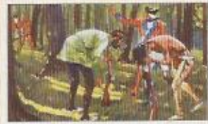
Die Arbeit der Indianer: Die Indianer sind hier zu sehen, die sie mit ihren Waffen und ihren Tieren durch das Land ziehen. Die Eroberer sind ihnen gegenüber zu sehen, die sie mit ihren Pfeilen und ihren Speeren bekämpfen.