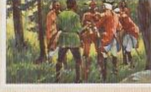
Die Arbeit der Indianer: Die Indianer sind hier zu sehen, die sie mit ihren Waffen und ihren Tieren durch das Land ziehen. Die Eroberer sind ihnen gegenüber zu sehen, die sie mit ihren Pfeilen und ihren Speeren bekämpfen.